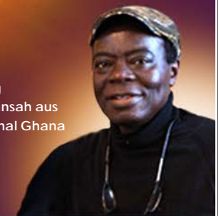
mit König Togbui Céphas Bansah aus Hohoe Gbi Traditional Ghana

Council of World Elders | Panoramaweg 27 | D-61194 Niddatal Telefon/Fax: 0049-6187-290 553 - headoffice@council-of-world-elders.de