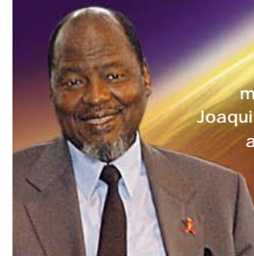
mit Ex-Präsident Joaquim Alberto Chissano aus Mosambik